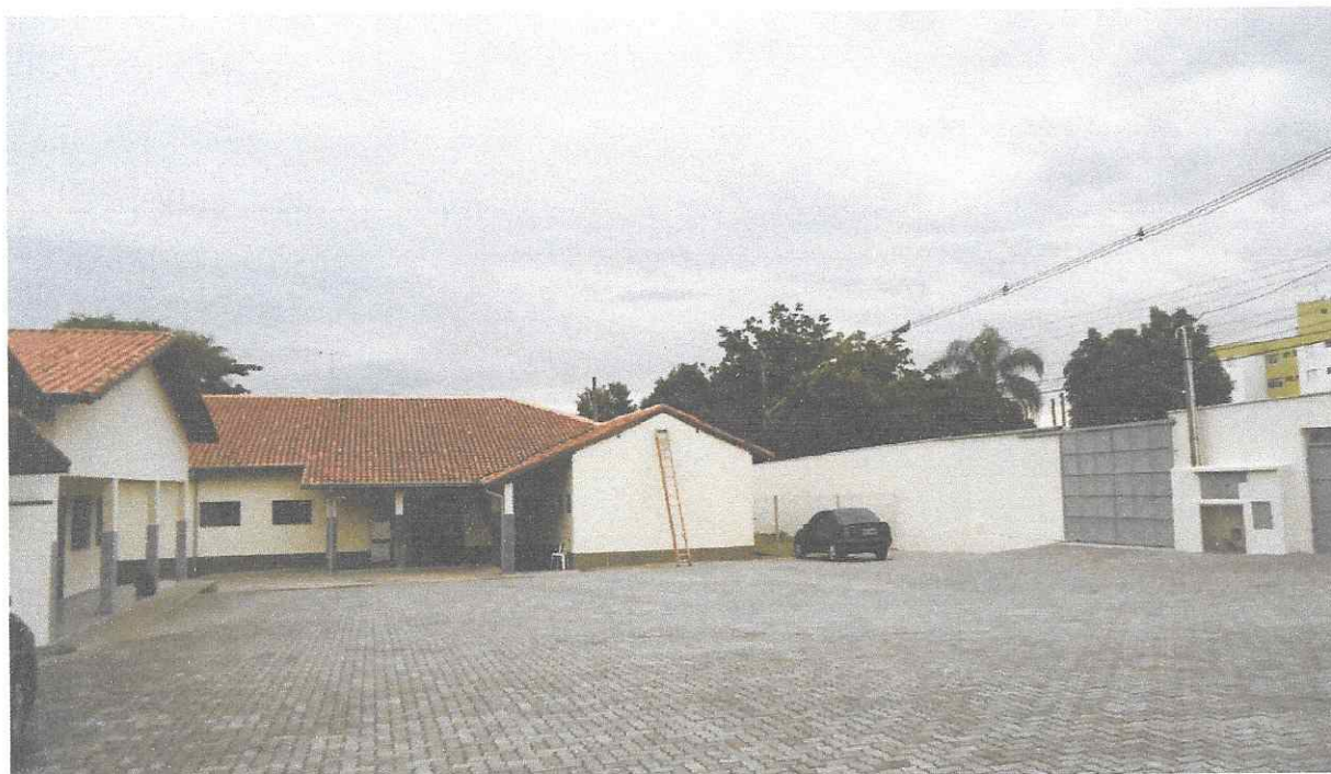
Colocação das calhas